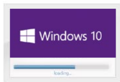
Boot up Windows