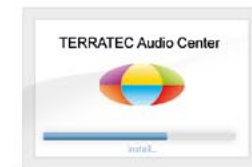
Install Control Panel