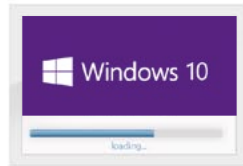
Boot up Windows