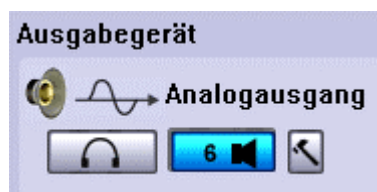
Configuración inicial en el panel de control

En las configuraciones principales puede elegir entre el modo de dos o seis canales. Para el modo de dos canales haga clic en el símbolo de los auriculares. Si desea disfrutar del sonido Surround, active el modo de seis canales haciendo clic en el botón correspondiente.