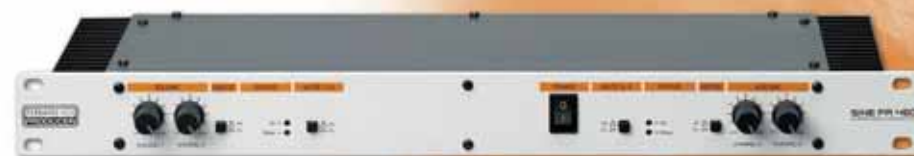
SINE PA 460