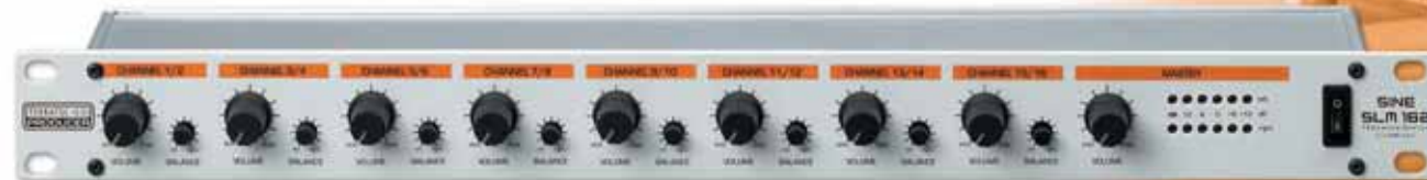
SINE SLM 162