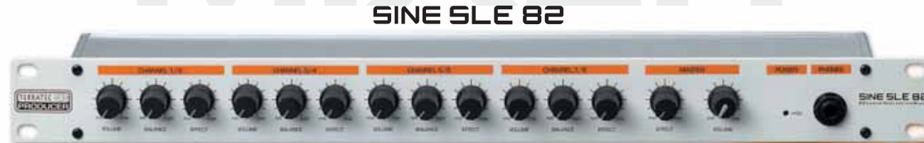
SINE SLE 82

Und weil ein gutes Rack teuer und der Platz darin immer knapp ist, haben wir das alles in einem 19-Zoll-Gehäuse mit nur einer Höheneinheit untergebracht. Was aber natürlich nicht zu Lasten der Qualität geht. Bei einem Rauschabstand von > 97 dB und einem Frequenzgang von 20 Hz – 20 kHz sind Störgeräusche kein Thema, der Sound geht verlustfrei durch den Mixer.