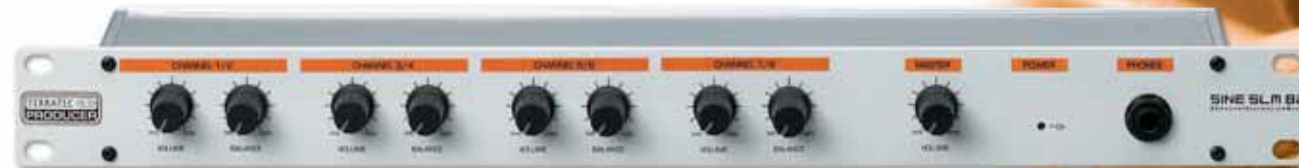
SINE SLM 82